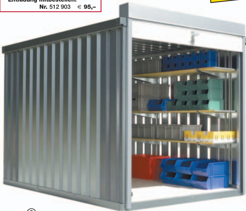
③ mit Lagerregal (Zubehör)