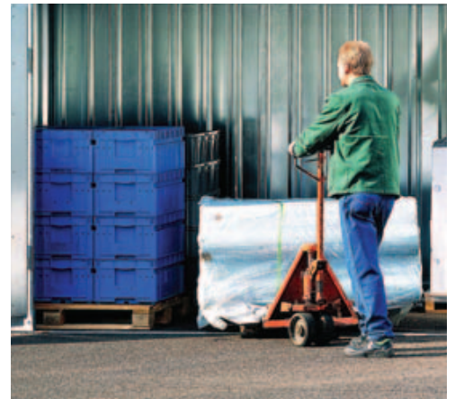
Ausführung ohne Boden, ebenerdiger Zugang

* Dachlichtband nicht kombinierbar mit Vliesbeschichtung ** Vliesbeschichtung nicht kombinierbar mit Dachlichtband