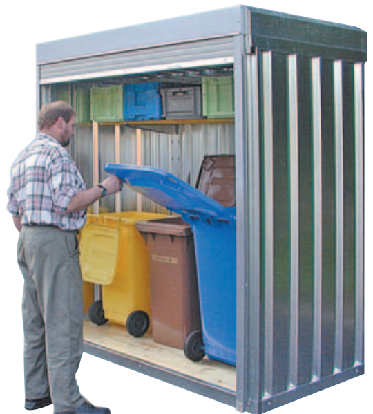
① mit Dachattika (Zusatzausstattung)