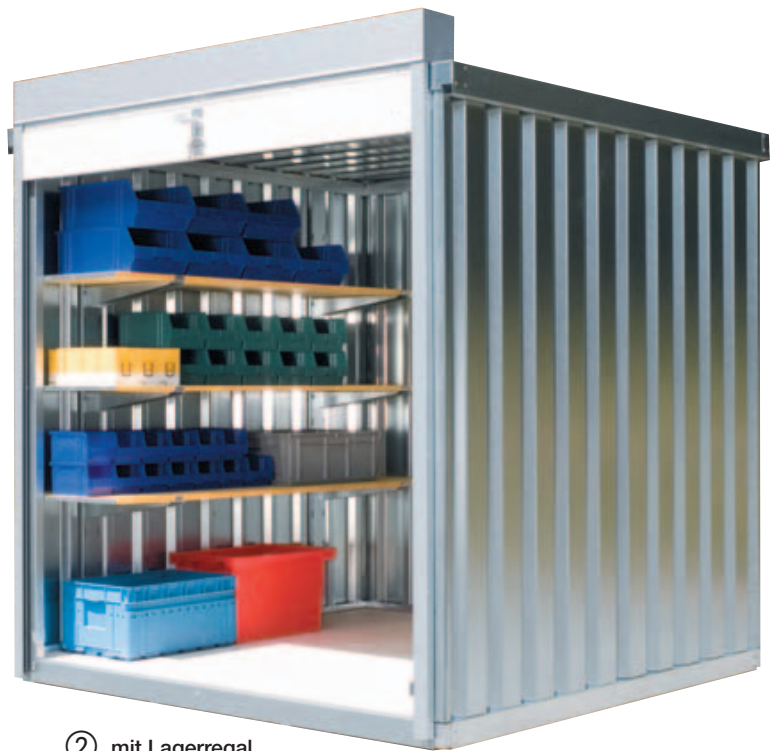
② mit Lagerregal (Zubehör)

Abladen mit Stapler oder Kran erforderlich. Bei Bedarf bitte Entladung mitbestellen: Nr. 512 903 € 95,-