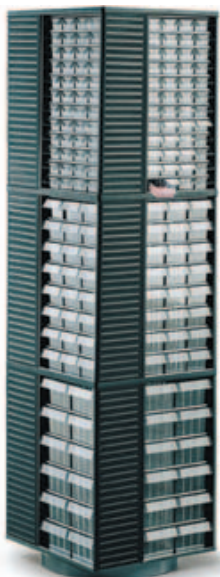
⑧ Drehständer und 12 Magazine (Die Magazine bitte separat bestellen)