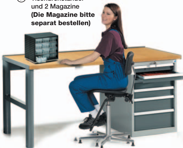
⑨ Tischdrehständer und 2 Magazine (Die Magazine bitte separat bestellen)