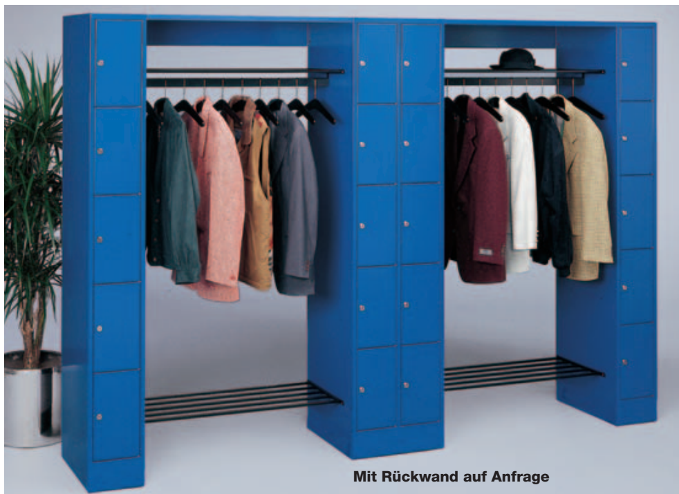
Mit Rückwand auf Anfrage